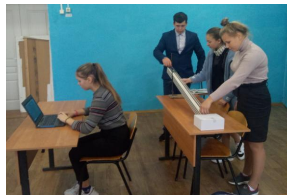
Определяем ускорение при движении тела по наклонной плоскости. Физика 9 класс.