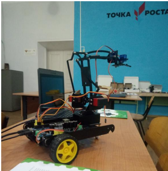
Отладка манипулятора с плоскопараллельной кинематикой. Кружок «Робототехника»