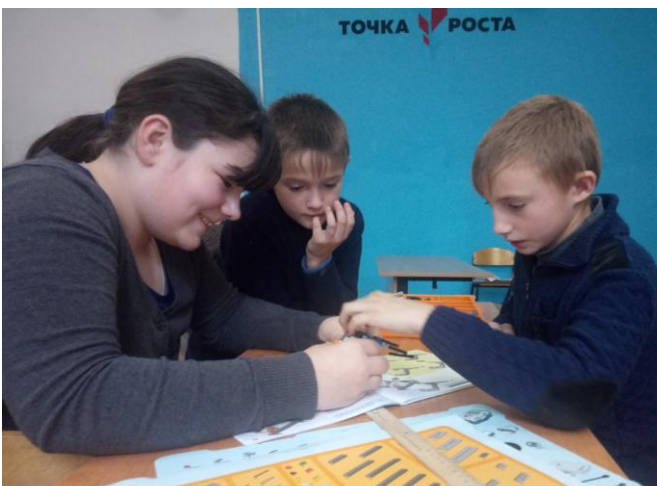
На занятии кружка «Робототехника»